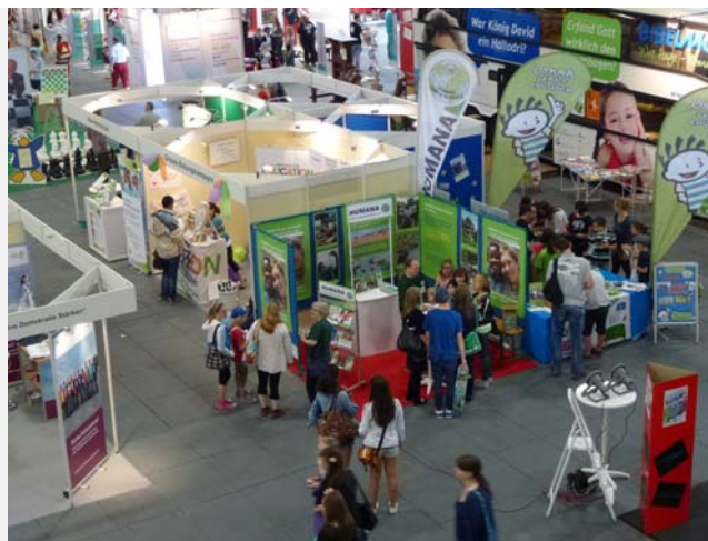
Infostand auf der Jugendmesse YOU in Berlin, 2012. Die Programme führen zu Bachelor /B-certificates in Pädagogik bzw., „Fighting with the Poor“.