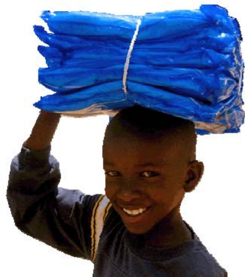
Moskito-Netze für die ganze Familie! Grüße vom Projekt HOPE Benguela in Angola.

Unsere Ausgaben für Werbung, Verwaltung und Information im Inland beliefen sich auf weniger als 5 % der Gesamtausgaben. Wichtigster Finanzierungspartner war, wie in den Vorjahren, HUMANA Kleidersammlung GmbH.