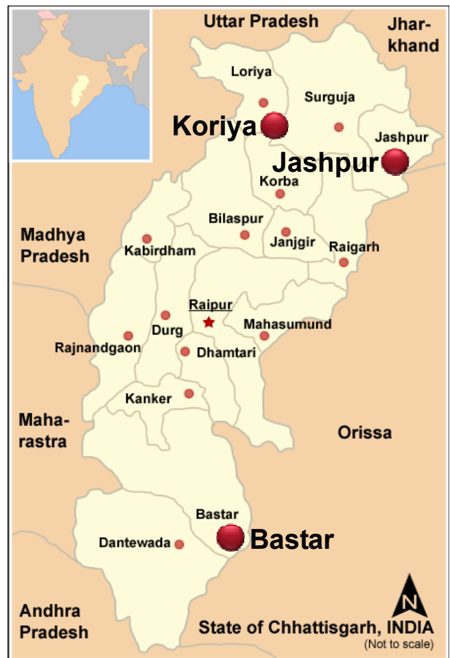
HUMANA Projekte zur Verbesserung der Lehrerausbildung im Bundesstaat Chhattisgarh, Indien

*) DNS steht für „Das Notwendige Seminarium“, eine Bezeichnung, die 1972 in Dänemark geprägt und seither auch an den HUMANA Lehrerausbildungsstätten in Afrika verwendet wurde.