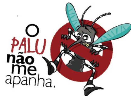
„Die Malaria kriegt mich nicht!“ T-shirts mit diesem Logo wurden an Schulkinder verteilt.