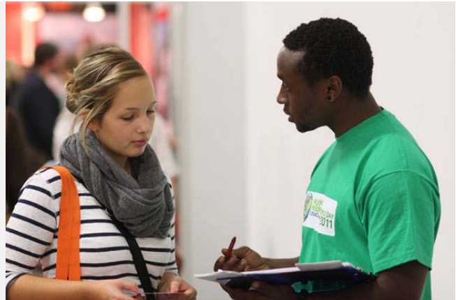
Calou informiert über die One World University. Berlin, September 2011 auf der Bildungsmesse „Einstieg Abi“. Die Programme führen zu Bachelor bzw. B-certificates in Pädagogik bzw. „Fighting with the Poor“ und beinhalten lange Afrika-Reisen / Einsätze an HUMANA-Projekten.