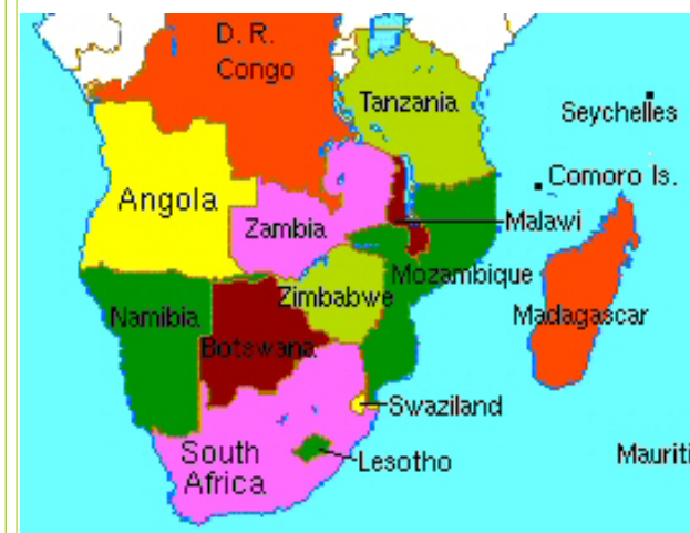
Titelbild: Ausflug zum Mount Mulanje, Nähe DAPP Mikolonge Vocational School, Malawi.